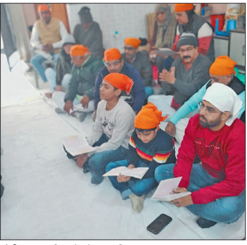
सोनीपत। कार्यक्रम के दौरान उपस्थित श्रद्धालुगण।

संगठन के वार्षिकोत्सव की तैयारियों की रूपरेखा तय करने के उपलक्ष्य में बैठक का आयोजन किया गया, जिसमें आगामी कार्यक्रमों की योजनाओं और जिम्मेदारियों पर विस्तार से चर्चा की