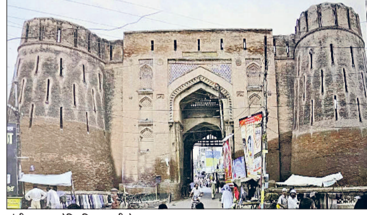
हांसी नगर का ऐतिहासिक बड़सी गेट का दृश्य।

हरियाणा सरकार ने हांसी को एक नया जिला बनाकर इस ऐतिहासिक नगर को पुनर्जीवित कर दिया है। सदियों पुराने इस ऐतिहासिक नगर का प्राचीन नाम आसिका होता था जो शाही सुलेमान मार्ग पर स्थित था। यहां के ऐतिहासिक किले का निर्माण सम्राट पृथ्वीराज द्वारा किया गया था। इसका समय-समय पर शासकों ने भरपूर उपयोग किया था। आयरलैंड वासी जार्ज थॉमस द्वारा वर्ष 1797 में हांसी को अपने नवगठित राज्य हरियाणा की राजधानी बना लिया था। प्राचीन किले में उसने सिक्के ढालने के वास्ते टकसाल भी स्थापित की थी, लेकिन चार वर्षों बाद 1801 में एक लम्बे लड़े गए युद्ध के बाद उसको