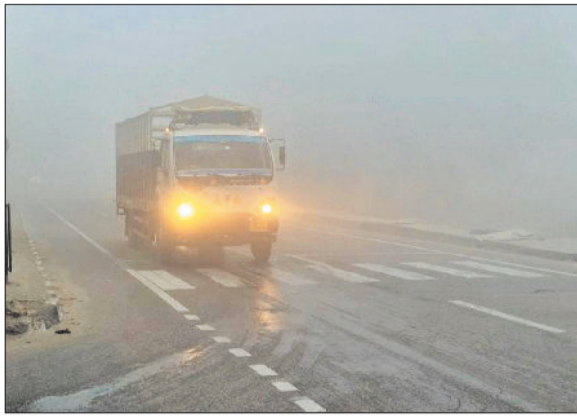
सोनीपत। नेशनल हाइवे पर कोहरे के बीच निकलता भारी वाहन।

घने कोहरे के बीच सोनीपत में रविवार की सुबह हादसों के नाम रही जहां कंवाली के पास दो आँटो की भिड़त में चार महिलाओं समेत पांच लोग घायल हो गए जबकि नसीर बांगर में ट्रैक्टर ट्राली पलटने से एक युवक गंभीर रूप से घायल हुआ है। इन हादसों ने शीतलहर के बीच सड़कों पर बढ़ते खतरे को एक बार फिर उजागर कर दिया है। रविवार को कोहरे का असर इतना