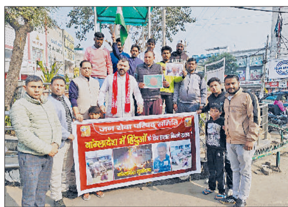
सोनीपत। विरोध प्रदर्शन करते संगठन के सदस्य।

रहे। प्रतिभागियों ने कहा कि यह विरोध आगे भी जारी रहेगा ताकि पीड़ितों के समर्थन का मजबूत संदेश दिया जा सके। प्रदर्शन शांतिपूर्ण ढंग से संपन्न हुआ और संगठन के पदाधिकारियों ने संबंधित मुद्दों पर संगठित प्रयास जारी रखने की बात कही।