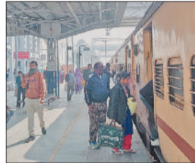
लेटलतीफी का शिकार बनीं। दिल्ली अंबाला रेल मार्ग पर रविवार का दिन यात्रियों के लिए बेहद कष्टकारी साबित हुआ। लंबी दूरी की एक्सप्रेस और सुरप्रफाट