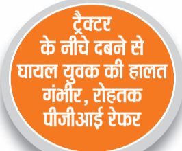
हरिभूमि न्यूज ► सोनीपत

जिले में मौसम के मिजाज में लगातार आ रहे बदलाव ने जनजीवन को बुरी तरह प्रभावित कर दिया है। रविवार की सुबह जिले के लोग जब सोकर उठे तो चारों ओर सफेद चादर लिपटी हुई थी। सुबह साढ़े छह बजे अचानक गिरे कोहरे ने रफतार पर ब्रेक लगा दिया। दृश्यता कम होने की वजह से सड़कों पर वाहन रंगते नजर आए और इसका सीधा असर जिले की यातायात व्यवस्था पर पड़ा। ग्रामीण इलाकों में तो स्थिति और भी गंभीर रही जहां दोपहर तक सूरज के दर्शन नहीं हुए।