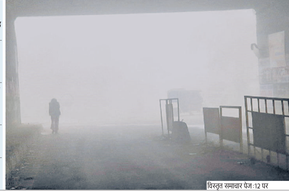
विस्तृत समाचार पेज :12 पर